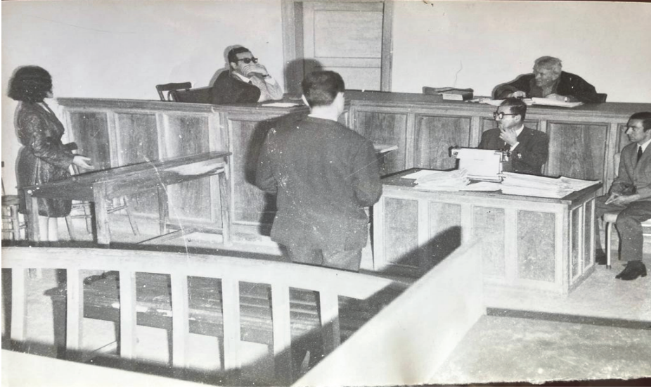
C. Savcılığı Yaptığı Yıllardan