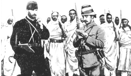
Trablusgarp Savaşı'nda Mustafa Kemal