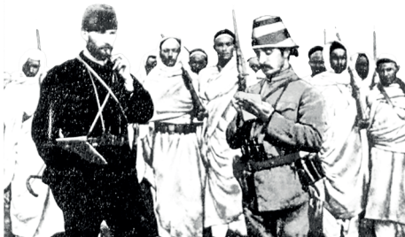
Trablusgarp Savaşı'nda Mustafa Kemal